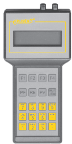
Komunikator KAP-03 i KAP-03 produkcji Aplisens