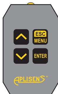
Pilot (nadajnik podczerwieni) RC-01

Wymiary gabarytowe w mm: Szerokość 72 , wysokość 36 , głębokość 95 Wymiary otworu montażowego w mm 67 × 32,5